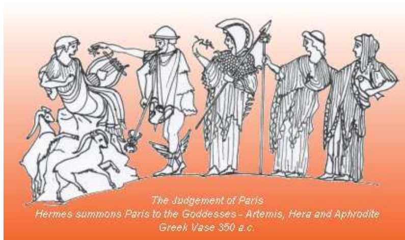
Paris a tři nejkrásnější bohyně

Venuše-Afrodité nepřímo zapříčinila Trójskou válku. Všechno začalo jako soutěž. Cílem bylo určit, která bohyně je nejkrásnější. Okruh byl zúžen na tři: Juno, Pallas Athénu a Afrodité. Jako soudce byl vybrán Zeus. Ten ale odmítl a poradil, aby se zeptaly mladého pastýře Parida. Ten měl soudit ne podle samotných bonyň, ale podle darů, které mu přinesly. Juno mu nabídla vládu nad Evropou a Asií, Pallas Athéna mu nabídla vést vojsko Trójanů do vítězné bitvy proti řeckům a Afrodité mu nabídla nejkrásnější ženu na světě. Paris dal jako výraz své volby zlaté jablko Afrodité a ta ho zavedla k Trójské Heleně. Tím zavdala důvod k Trójské válce