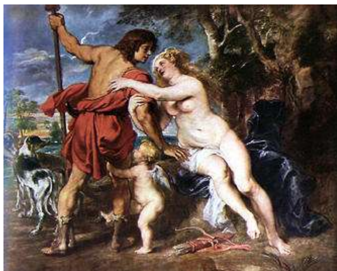
Venuše a Adonis

Venuše-Afrodité nepřímo zapříčinila Trójskou válku. Všechno začalo jako soutěž. Cílem bylo určit, která bohyně je nejkrásnější. Okruh byl zúžen na tři: Juno, Pallas Athénu a Afrodité. Jako soudce byl vybrán Zeus. Ten ale odmítl a poradil, aby se zeptaly mladého pastýře Parida. Ten měl soudit ne podle samotných bonyň, ale podle darů, které mu přinesly. Juno mu nabídla vládu nad Evropou a Asií, Pallas Athéna mu nabídla vést vojsko Trójanů do vítězné bitvy proti řeckům a Afrodité mu nabídla nejkrásnější ženu na světě. Paris dal jako výraz své volby zlaté jablko Afrodité a ta ho zavedla k Trójské Heleně. Tím zavdala důvod k Trójské válce