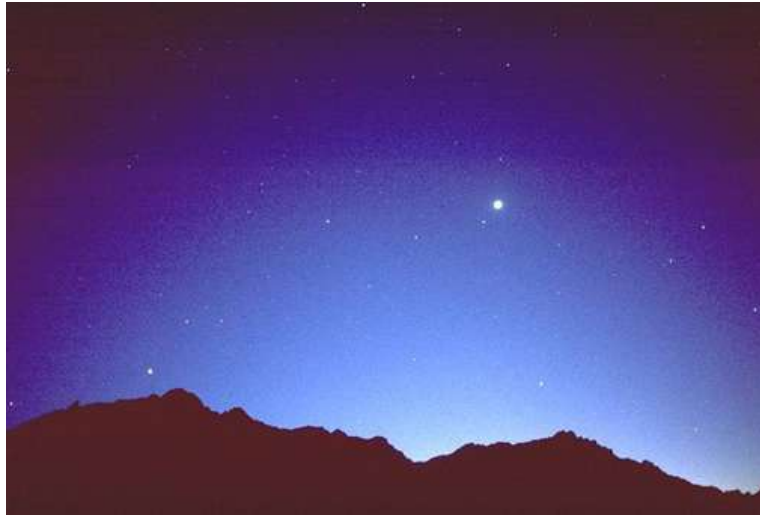
Venuše jako jasná „hvězda“ na obloze

Venuše je díky své jasnosti nejčastější planetou, které si lidé na obloze všimnou. Na Sibiři byla jedinou planetou, která měla jméno – Cholbon. Všimli si jí na ranní i večerní obloze. Občas zaznamenali i jinou jasnou planetu, ale Venuše vedla. Nikoho tedy nepřekvapí, že ji znali už v dávné minulosti.