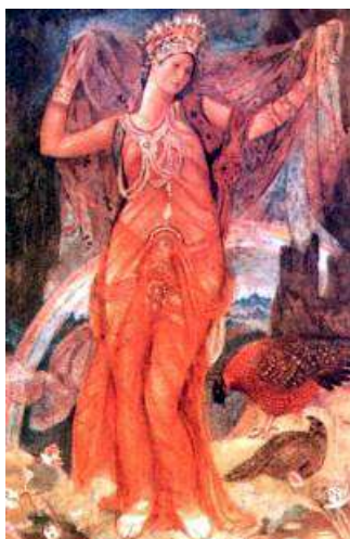
Sumerská bohyně Ištar

Tento příběh je podobný sumerské báji o bohyni Ištar. Sumerové, kteří od Řeků vyšli z řecké astronomie nazývali Venuši Inanna, Ištar nebo Eštar. Jako ranní hvězda to byla bohyně lásky, sexu a erotiky ale také války. Měla křídla, jezdila na lvu a byla ozbrojena lukem a šípy. Bývá často zobrazována poblíž boha Slunce. Její sestra, která bývala vidět večer, byla hlídačkou u brány říše smrti.