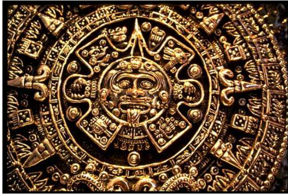
Májský kalendář

Astronomové ve střední Americe měli podobná pravidla. Jejich Maya byla bohyní válek, která rozsévala zkázu a smrt. Májští astronomové zaznamenávali svá přesná pozorování planety a jejich rituální kalendář byl založen na těchto pozorováních.